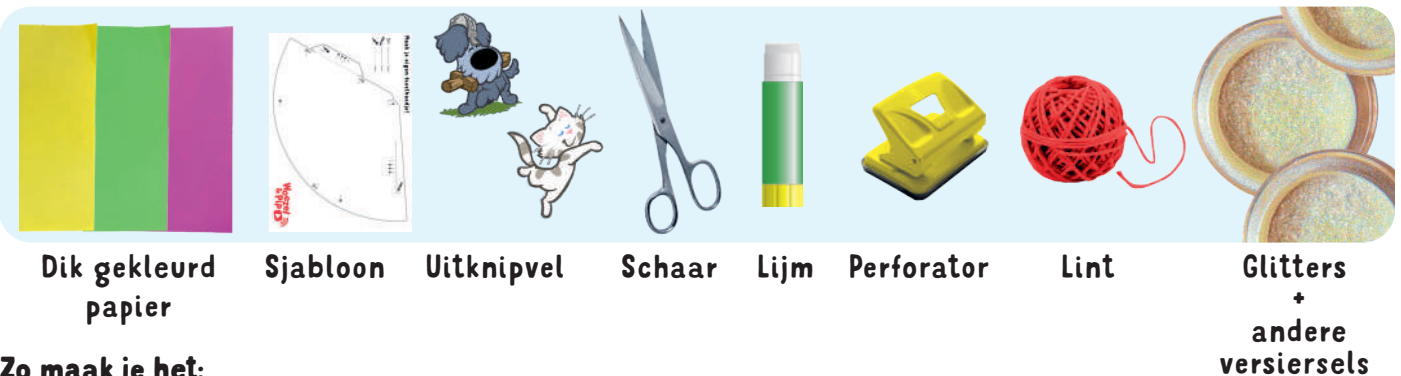
Dik gekleurd papier